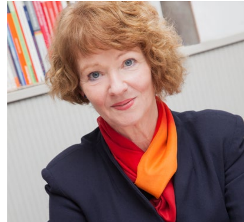
Professorin Dr. Ulrike Schildmann lehrt an der Technischen Universität Dortmund. Sie rät: »Es geht nicht darum, Frauen für Männerberufe zu begeistern, sondern die Perspektiven für alle zu erweitern.« Beraterinnen und Berater sollten für ungewöhnliche Berufswünsche offen sein.

sprechen. Dieser Ausgangspunkt müsse ernst genommen und ausgelotet werden: »Welche Motivation steckt hinter einem Berufswunsch? Sie ist ganz entscheidend! Und wie passt der Wunsch mit den strukturellen Voraussetzungen zusammen?«