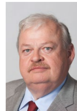
Guntram Schneider, Minister für Arbeit, Integration und Soziales in NRW

Wie erleben Sie den Arbeitsmarkt für junge Menschen mit Handicap? Und inwiefern kann STAR ihnen helfen?